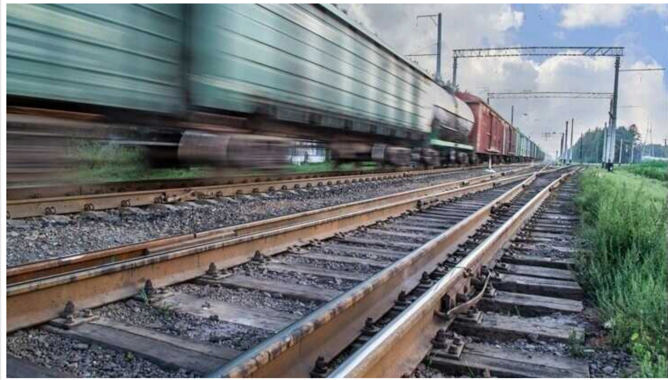
Підпали релейних шаф на залізниці та автомобілів військових продовжуються в Україні, - ЗМІ

В Україні й надалі підпалюють релейні шафи на залізниці та автомобілі військових.