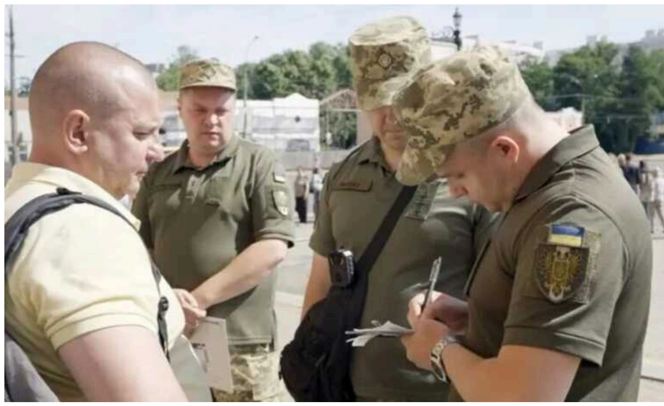
Через "Дію" вже забронювали 120 000 чоловіків

Через портал "Дія" вже забронювали майже 120 тисяч працівників критично важливих підприємств та тих, що працюють на потреби Сил безпеки й оборони. Електронне бронювання значно спростило процес: слід подати списки на порталі, система перевіряє дані, й упродовж доби надходить результат.