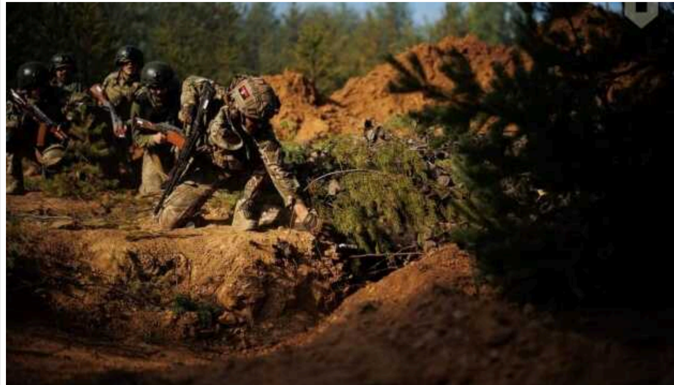
Ситуація на фронті: Протягом доби відбулось 108 бойових зіткнень

З початку доби на фронті відбулося 108 зіткнень, бої тривають на кількох напрямках.