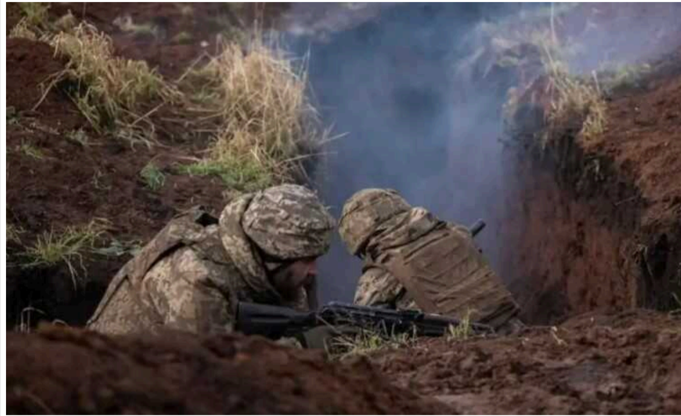
Військовий ЗСУ розповів про складну ситуацію на околицях Торецька