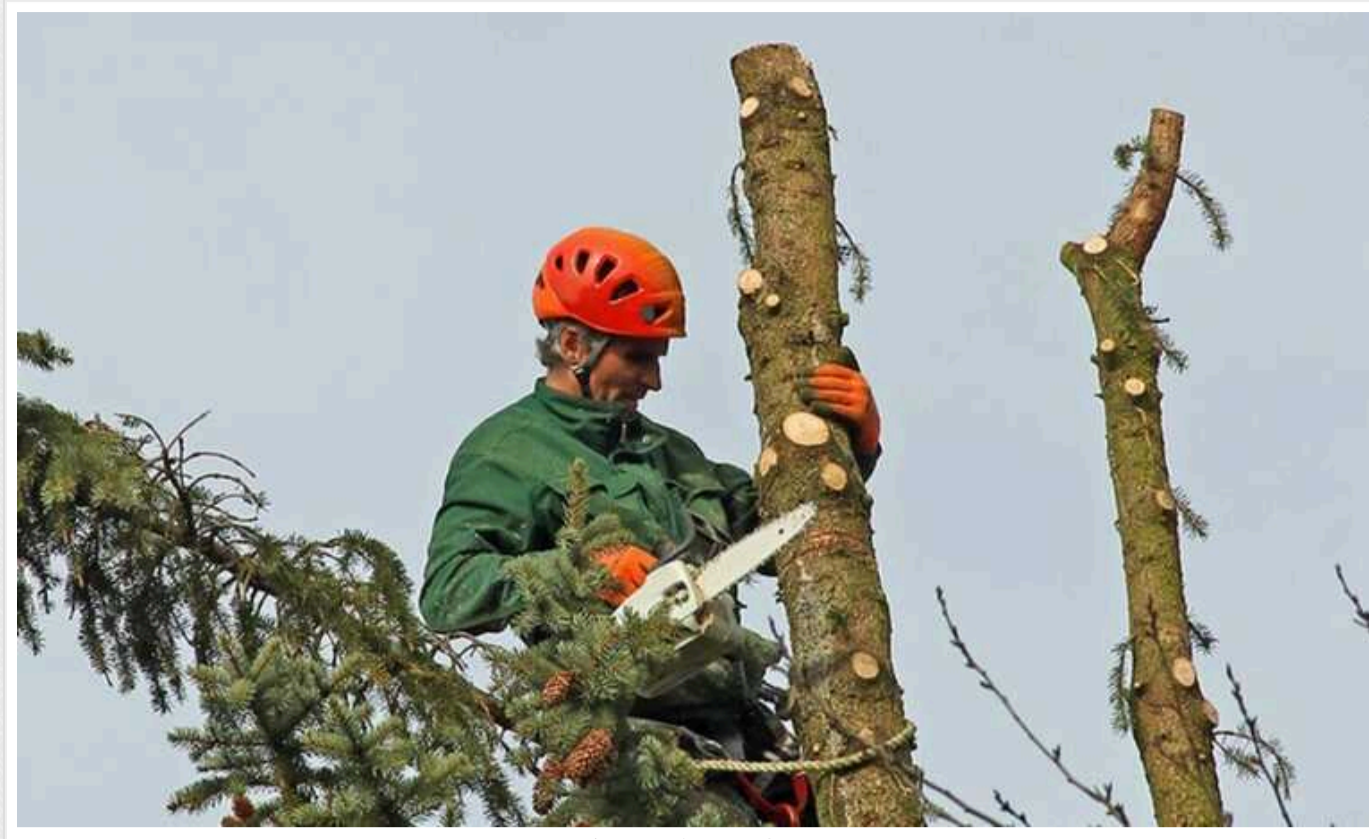
Майже 3 мільйони гривень планують витратити на обрізання дерев у Святошинському районі Києва

Відповідний тендер розмістили на сайті електронних закупівель Prozorro.