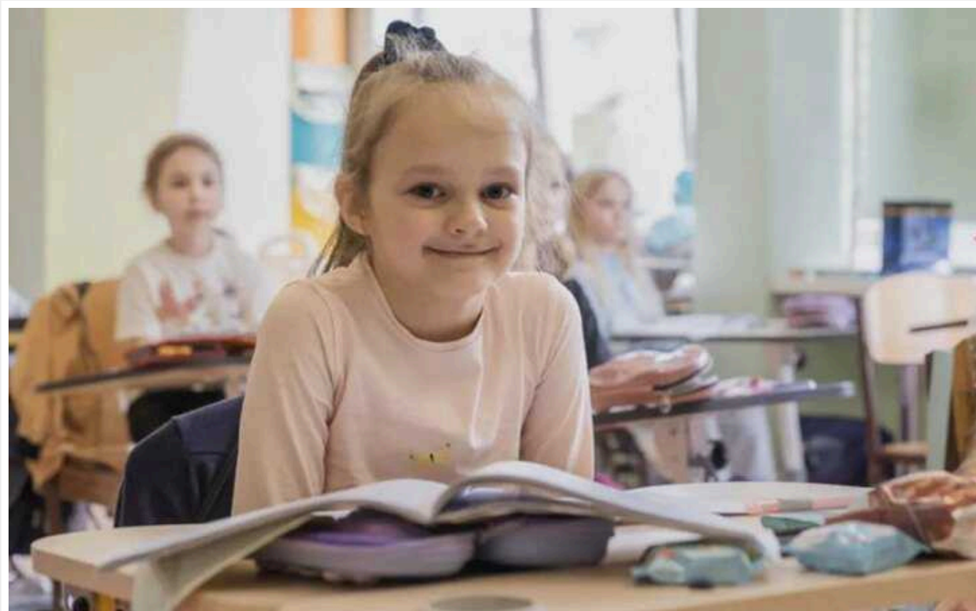
Видавництво «Атлант», засноване менш як рік тому, отримало від Міносвіти понад 100 замовлень вартістю майже 180 мільйонів гривень

Журналісти-розслідувачі з'ясували, що вартість друку могла бути завищена.