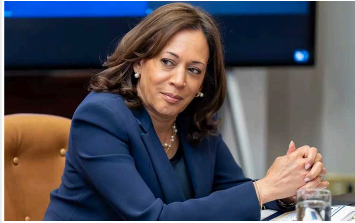
Гарріс звузила список претендентів на посаду віцепрезидента, - Reuters

Ймовірна кандидатка у президенти США від Демократичної партії Камала Гарріс звузила список претендентів на посаду свого віцепрезидента до двох – губернатора Пенсильванії Джоша Шапіро і губернатора Міннесоти Тіма Волца.