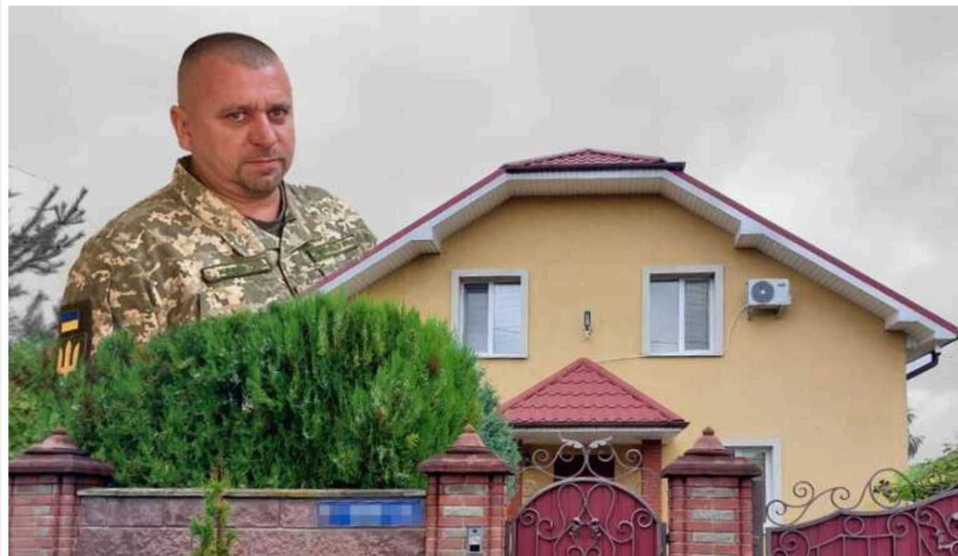
У Рівненській області ексголова ТЦК приховує свої автівки та будинок