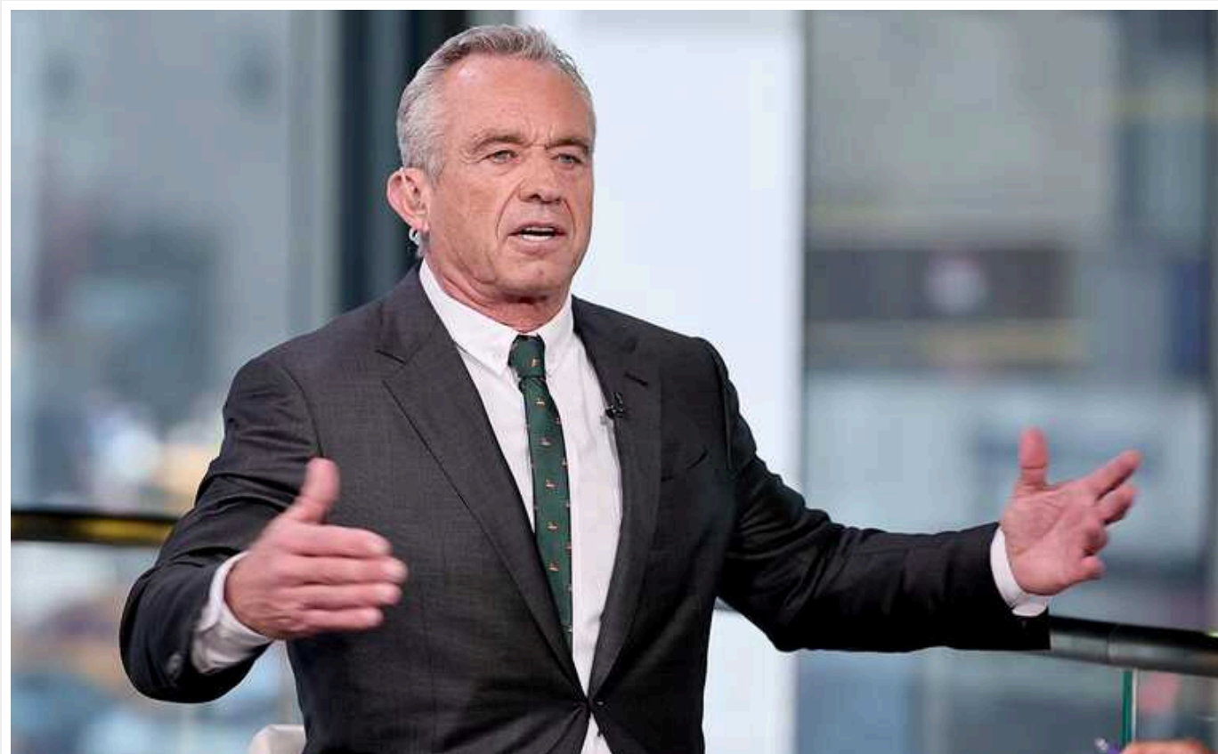
Кандидат у президенти США Роберт Кеннеді-молодший розповів, як 10 років тому підкинув у Центральний парк тушу ведмежати заради розіграшу

"Жінка, яка їхала переді мною, збила до смерті ведмежа... Тоді я зупинився, підібрав його і поклав у багажник, бо збирався освіжувати - туша була в дуже хорошому стані... А м'ясо я планував скласти в холодильник", - розповів політик у відео, опублікованому у його X.