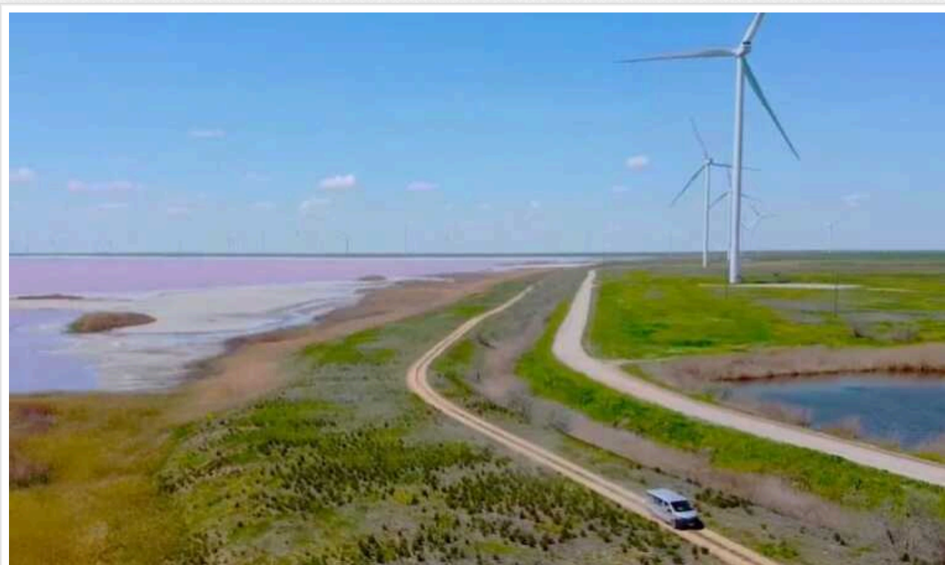
Росія на півдні України захопила найбільші в Європі сонячні та вітроелектростанції

За перші 8 місяців війни Україна втратила до 90% вітряної енергетики і до 50% сонячної, оскільки електростанції захопили ЗС РФ. Більшість із них знаходилися на півдні країни.