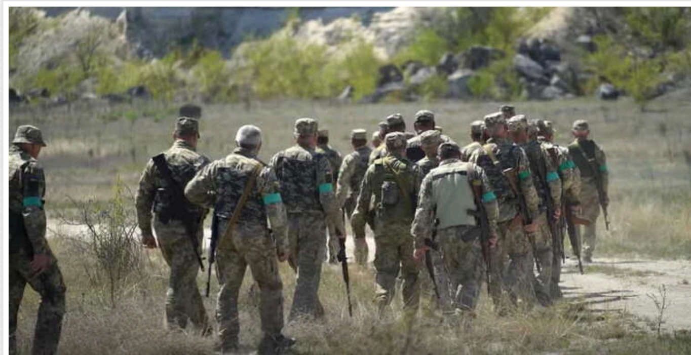
У мережі родичі бійців 120-ої бригади ТрО заявляють про її розгром на фронті: в бригаді спростували

Про це повідомляє сама бригада, заявляючи, що це "неправдиві повідомлення", які поширюють люди, "котрі не володіють ситуацією".