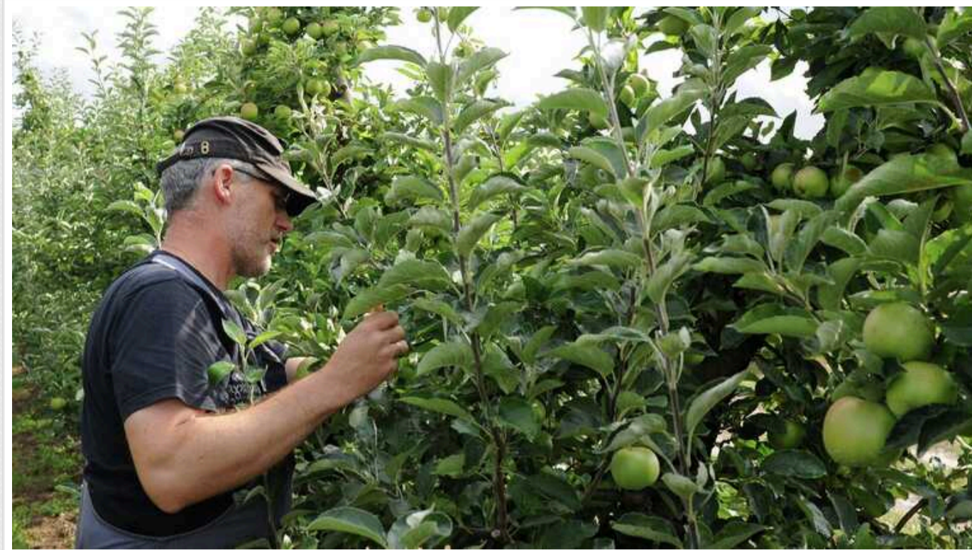
Через скорочення міграції українців у Польщі не вистачає робочих рук

Видання Rzeczpospolita пише, що в Польщі не вистачає робочих рук через скорочення міграції українців.