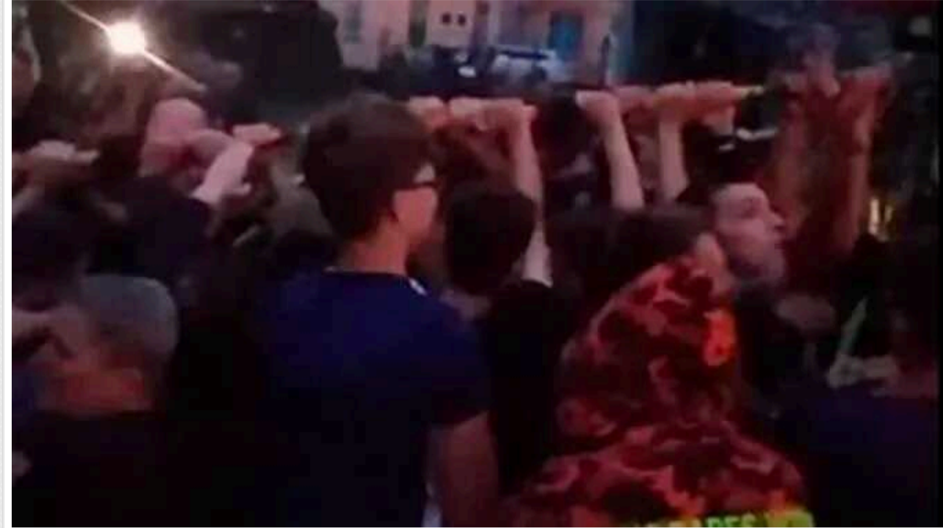
Мітинг під ТЦК у Ковелі: Поліція відкрила два кримінальні провадження

Правоохоронці встановлюють учасників інциденту та заявили про два кримінальні провадження.