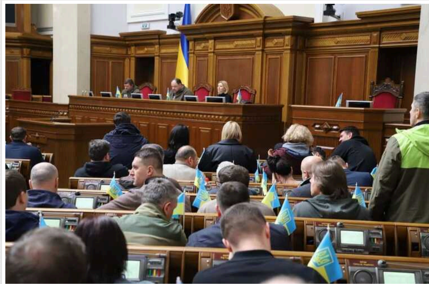
У ВРУ пропонують надати право вільного перетину кордону окремим категоріям громадян

У Раді пропонують надати право вільного виїзду за кордон народним депутатам, чиновникам, суддям, прокурорам, представникам громадських організацій, що входять до переліку заброньованих у зв'язку з отриманням іноземного фінансування.