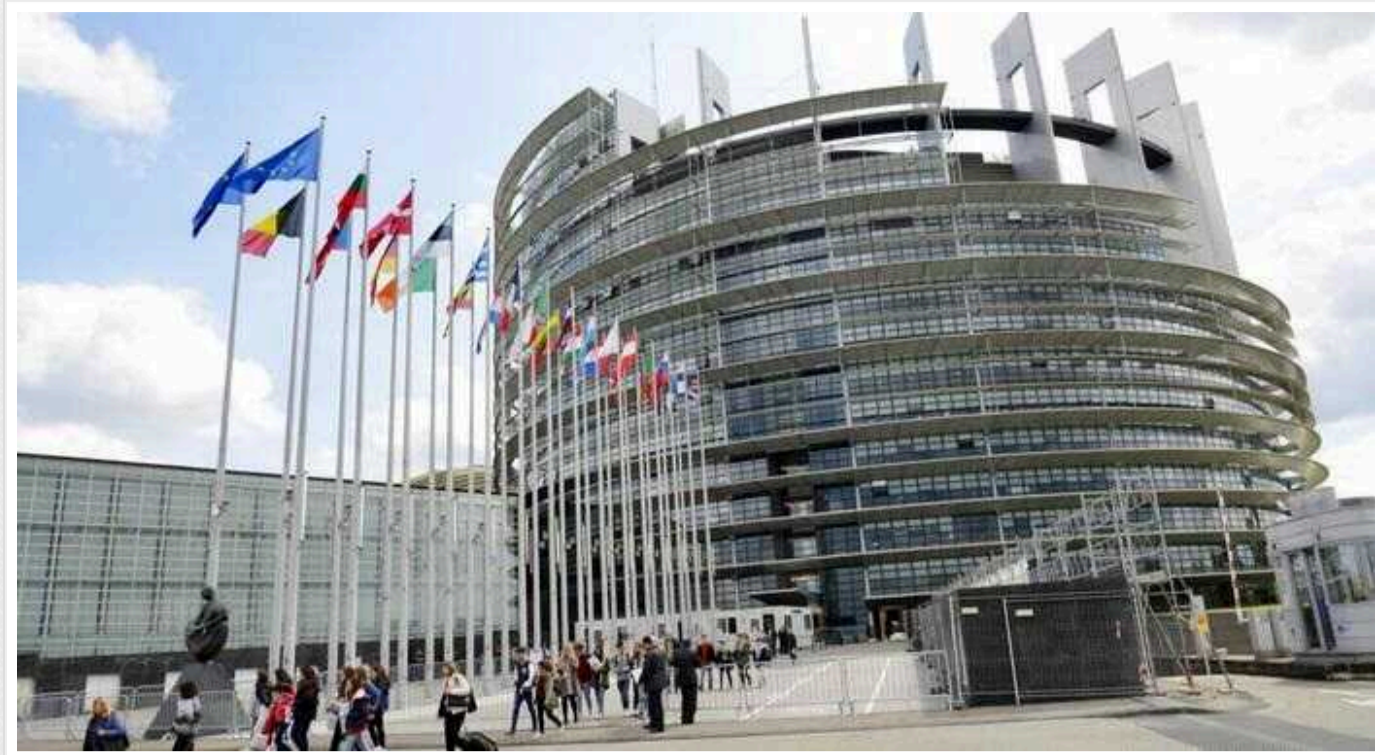
В Європарламенті закликають виключити Угорщину зі Шенгенської зони, - Politico

Politico повідомляє, що десятки депутатів Європарламенту закликають виключити Угорщину зі Шенгенської зони через пом'якшення нею візових обмежень для росіян та білорусів.