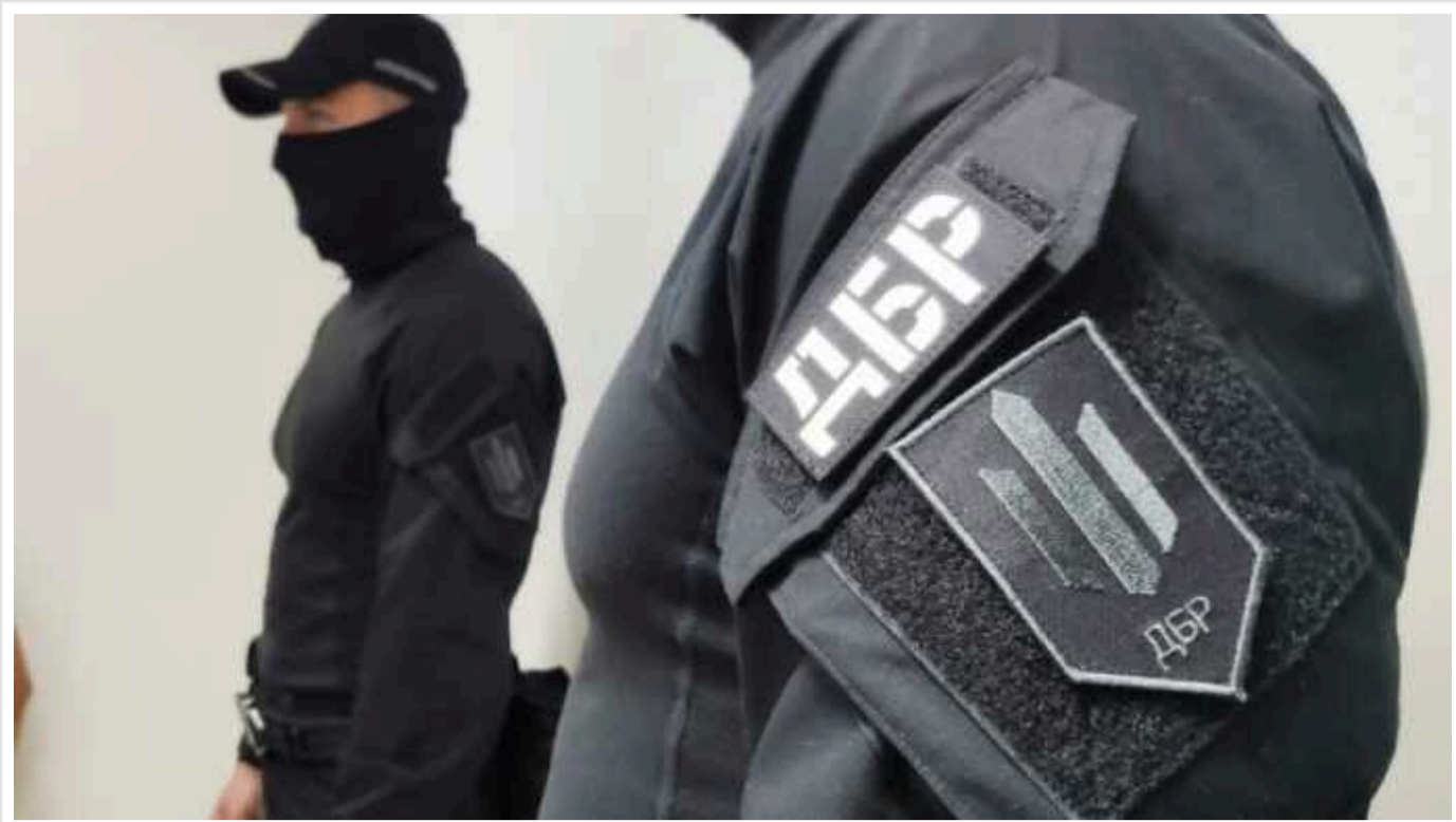
На Прикарпатті засудили співробітника військкомату, в якому фіктивно служили футболісти

На Івано-Франківщині суд оштрафував на 221 тисячу гривень співробітника військкомату. Він фіктивно оформив на службу місцевих футболістів.