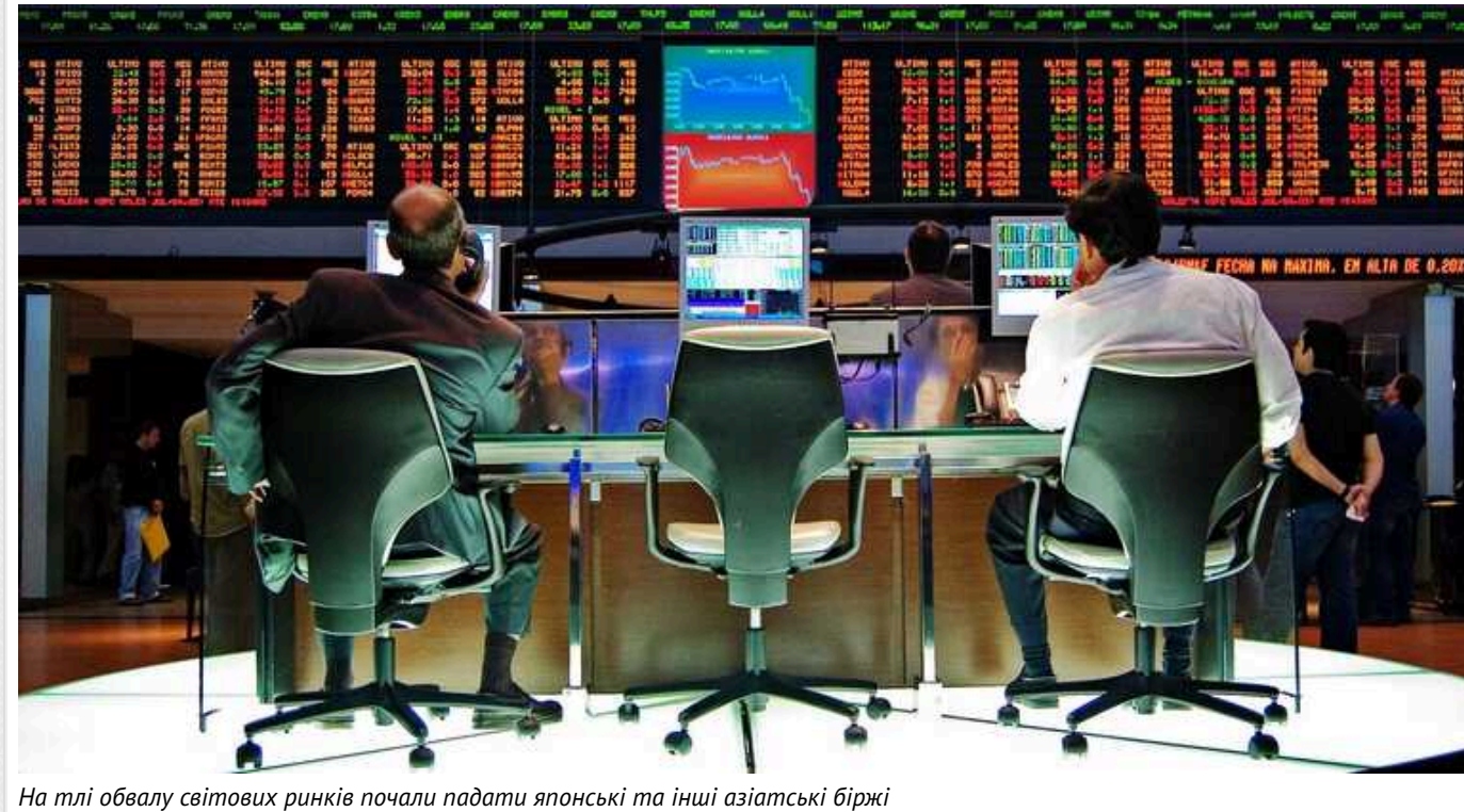
На тлі обвалу світових ринків почали падати японські та інші азійські біржі