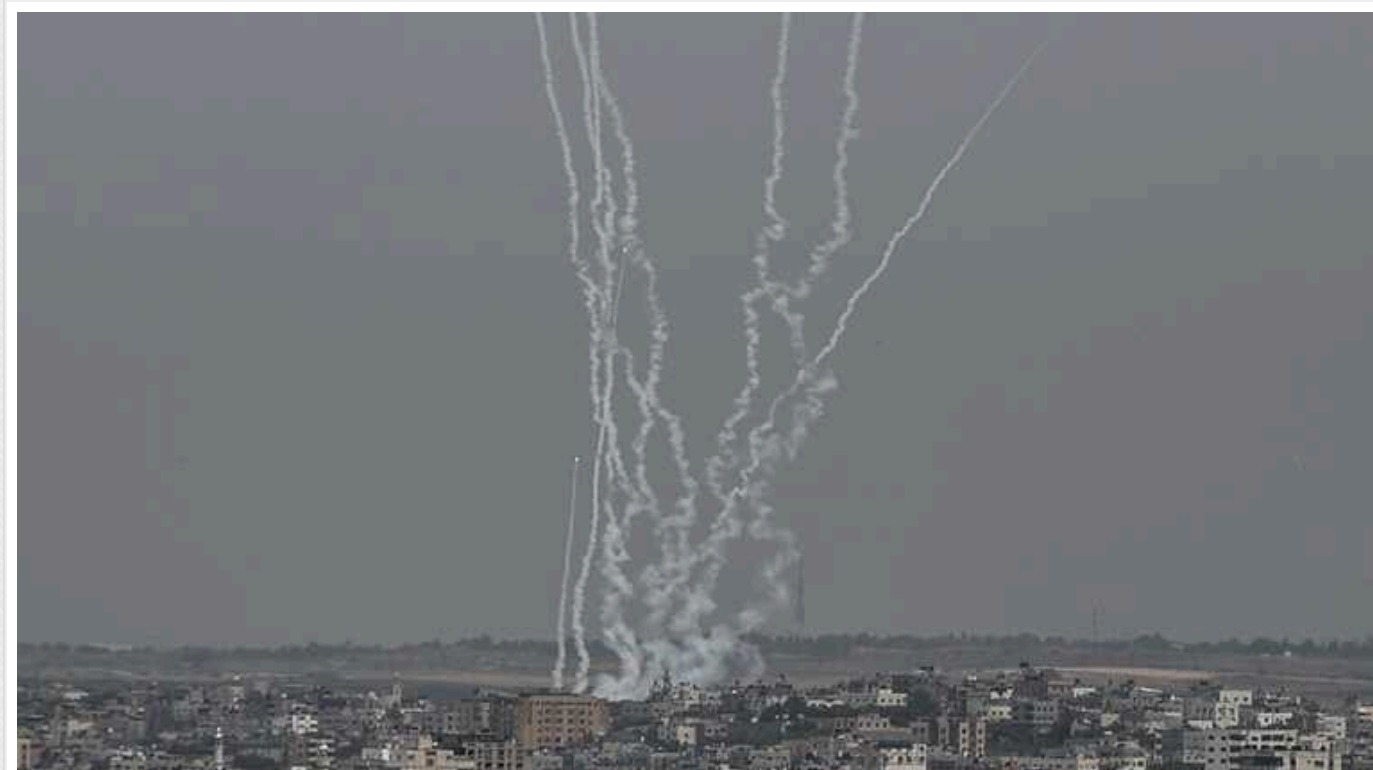
В Ізраїлі розглядають завдання превентивного удару по Ірану

Ізраїль розгляне можливість завдання превентивного удару для стримування Ірану, якщо виявить незаперечні докази підготовки нападу з боку Тегерана.