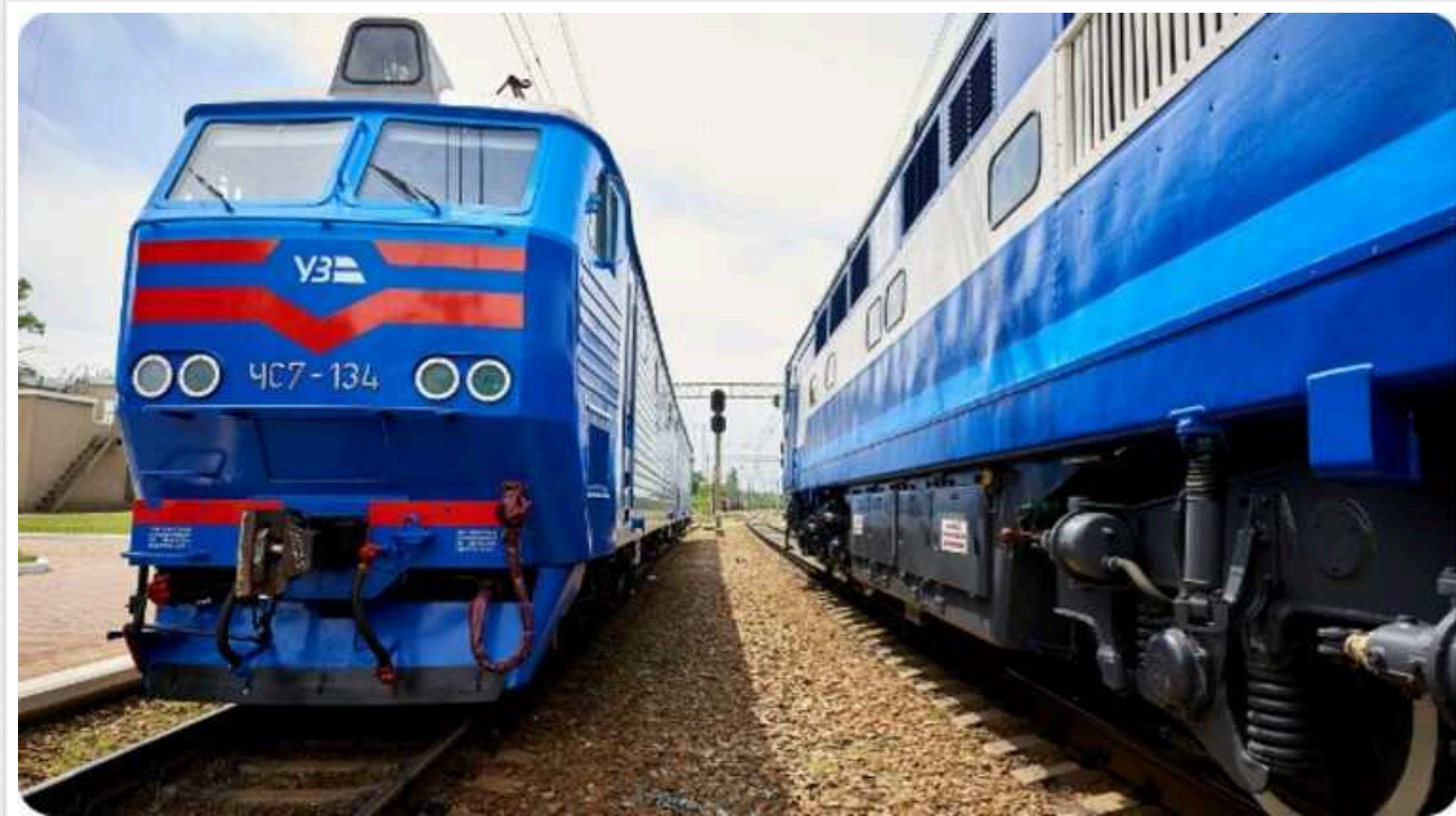
Унаслідок обстрілів у Полтавській області низка поїздів прямують із затримками

Унаслідок обстрілу в Полтавській області в неділю було пошкоджено залізничну інфраструктуру, низка поїздів змінили маршрути та слідують із затримками, повідомляє пресслужба АТ "Укрзалізниця" (УЗ) у понеділок уранці.