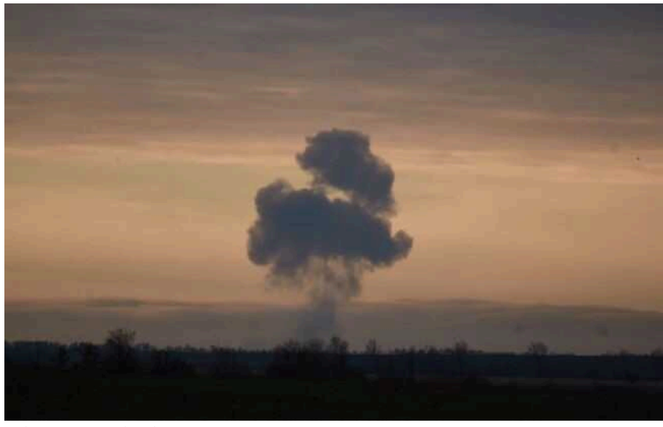
На Сумщині працює ППО, – ПС

“У Сумській області ППО працює по ворожому безпілотнику”, – Повітряні сили.