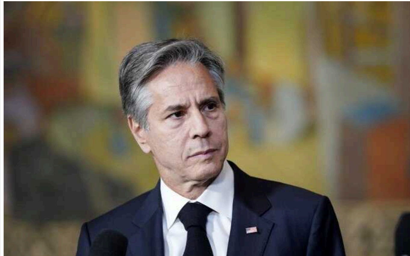
Ентоні Блінкен назвав імовірні терміни атаки Ірану та «Хезболли» на Ізраїль, – Axios