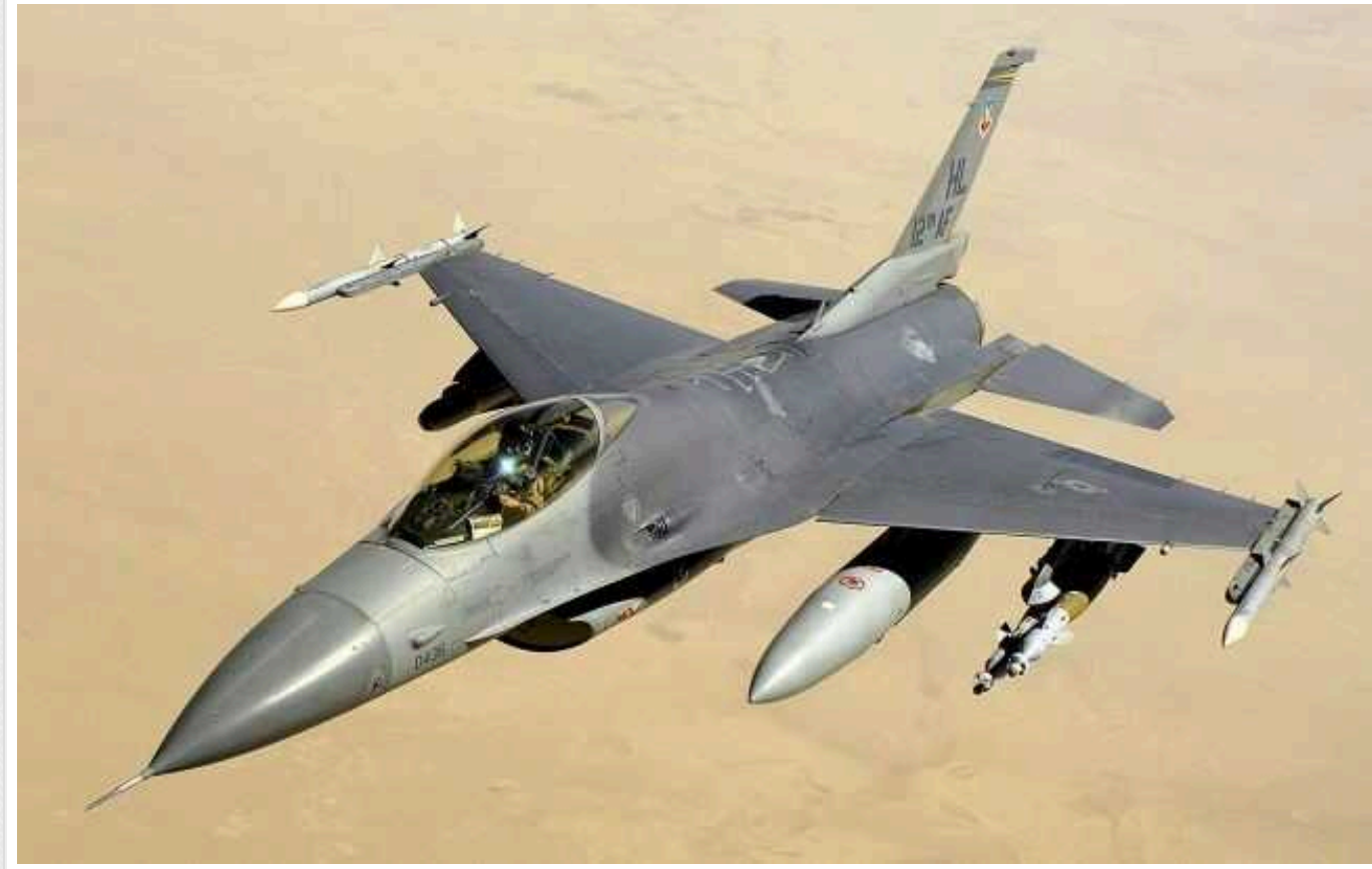
В ISW оцінили рефлексивну реакцію ворога після появи в Україні F-16: у РФ заговорили про «червоні лінії»

Російські провоченні блогери відреагували на прибуття винищувачів F-16 в Україну, намагаючись применшити потенційні результати, які ті можуть принести Силам оборони на полі бою. Вони спробували представити постачання літаків та інших західних систем озброєння як непереможну "червону лінію" Кремля.