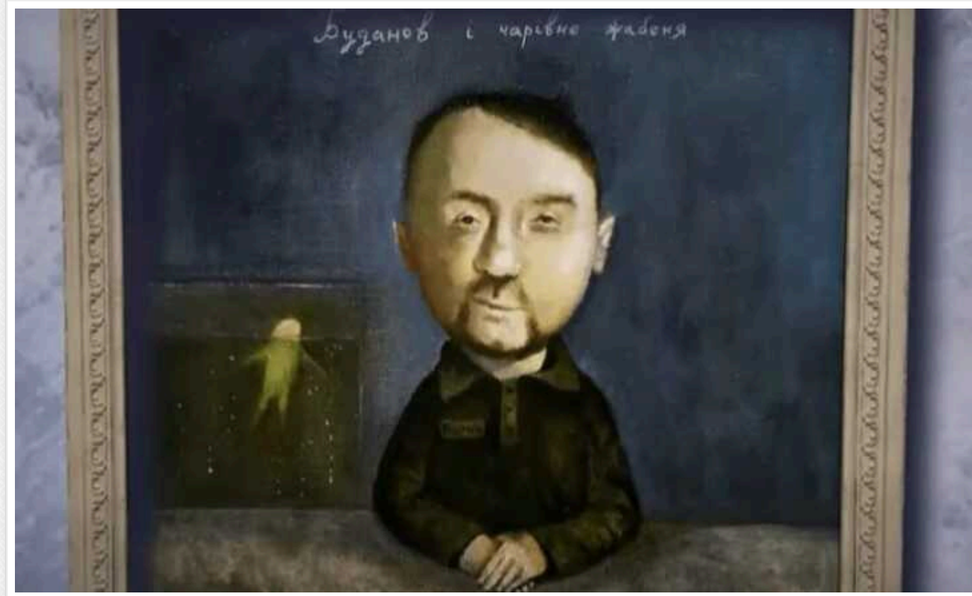
Художниця Гапчинська намалювала голову ГУР Буданова: він відреагував

Євгенія Гапчинська намалювала Кирила Буданова у своєму фірмовому стилі. І картину вже продано.