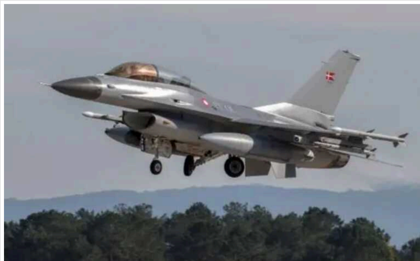
Українські винищувачі F-16 отримали систему раннього попередження про ракетний напад

Багатоцільові винищувачі F-16, які вже перебувають на озброєнні України, оснащені новітніми системами раннього попередження про ракетний напад. Вона забезпечує життєво важливе вдосконалення комплексу самозахисту літаків.