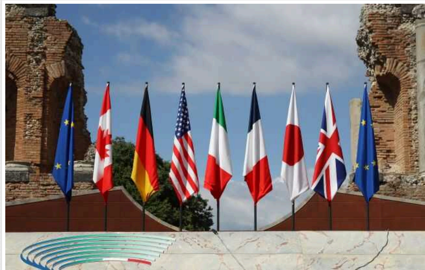
Глави МЗС G7 обговорили кроки для деескалації кризи на Близькому Сході

У неділю, 4 серпня, міністри закордонних справ країн G7 провели телефонну розмову щодо ситуації на Близькому Сході.