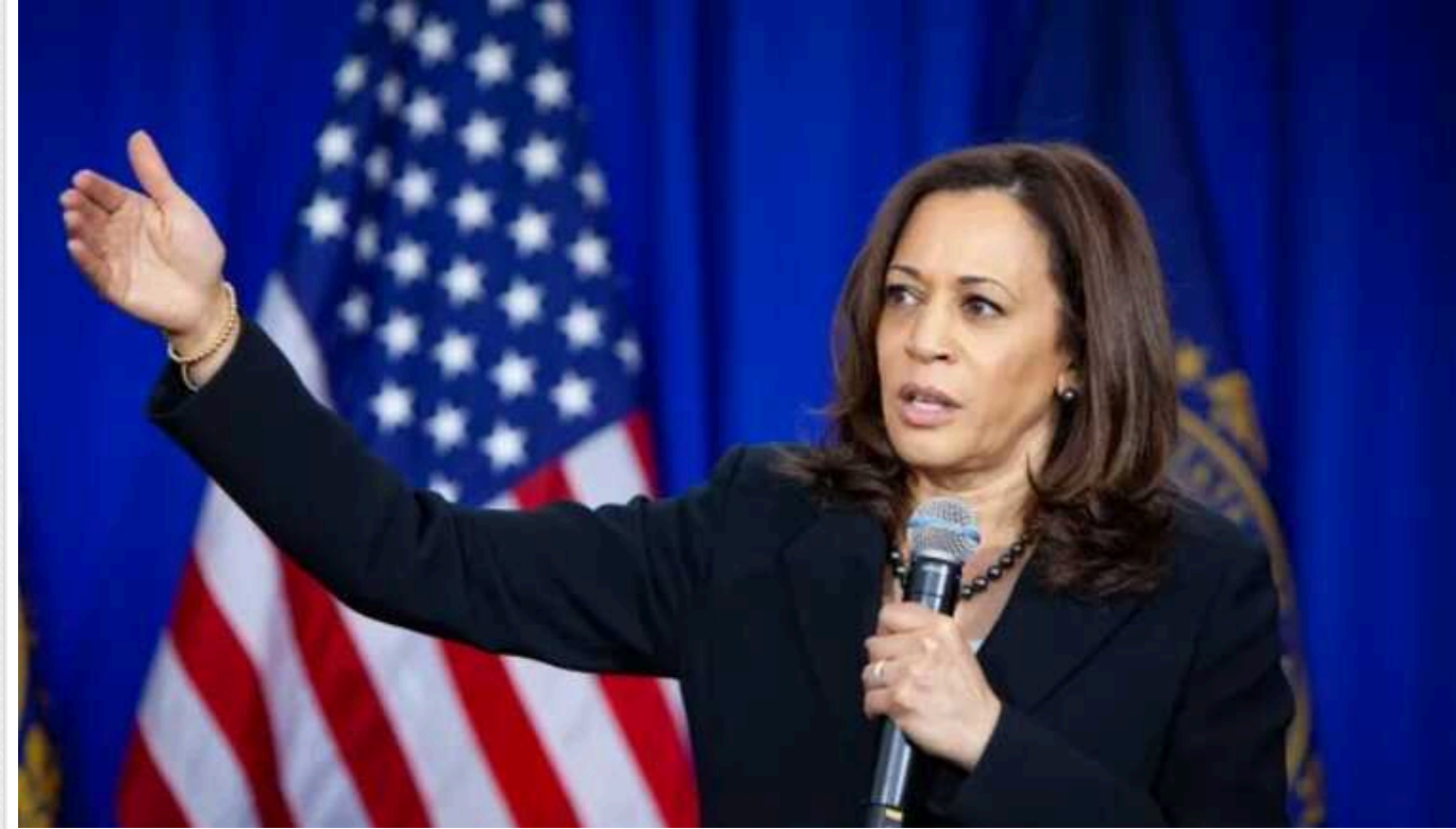
AP: Гарріс запускає кампанію для залучення виборців, яких відлякує кандидатура Трампа

Камала Гарріс запускає кампанію, щоб залучити на свій бік виборців-республіканців, яких відлякує Дональд Трамп.