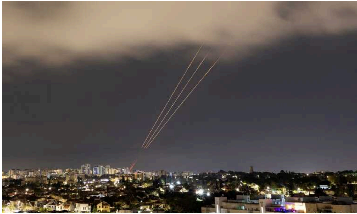
NBC News: Атака Ірану на Ізраїль може тривати кілька днів

Уряд Ізраїлю готується до потенційної багатоденної атаки з боку Ірану та його союзників із «Хезболли».