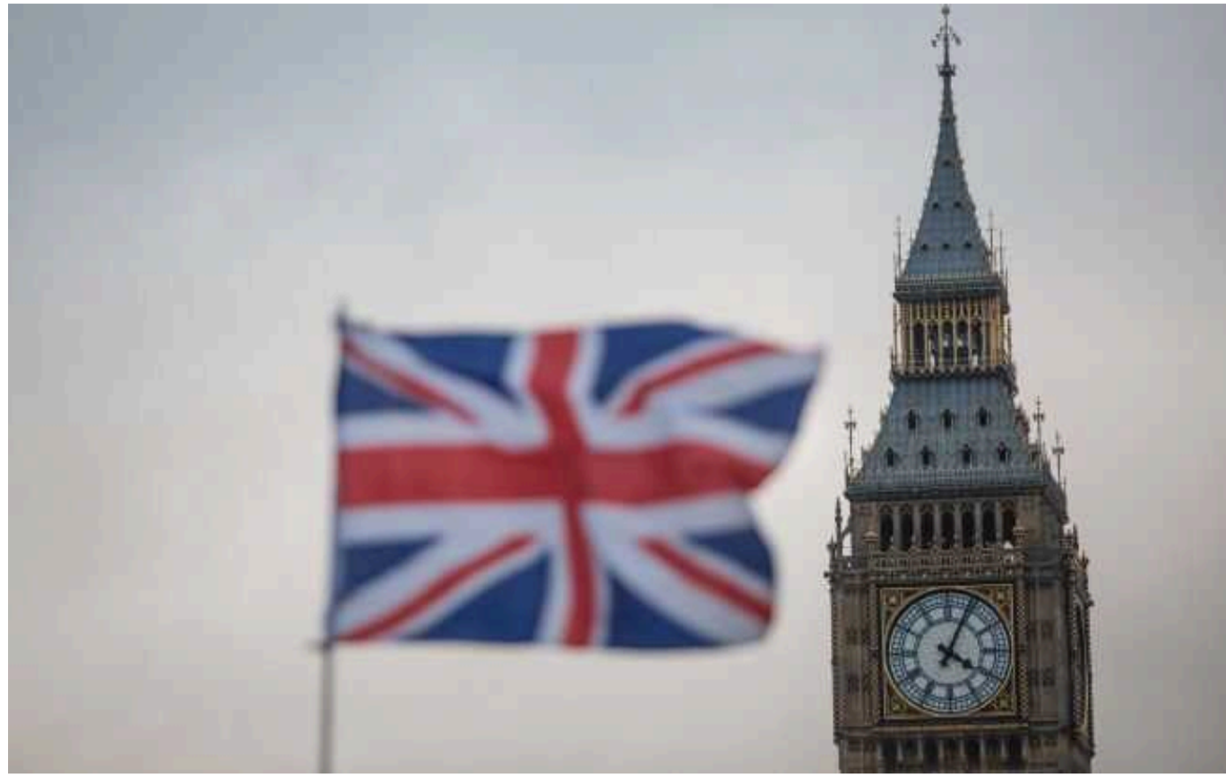
Британія евакуювала родини співробітників посольства у Лівані, - ЗМІ

Велика Британія заявила, що відкликала та евакуювала родини співробітників посольства у Бейруті через нестабільну ситуацію з безпекою в Лівані.