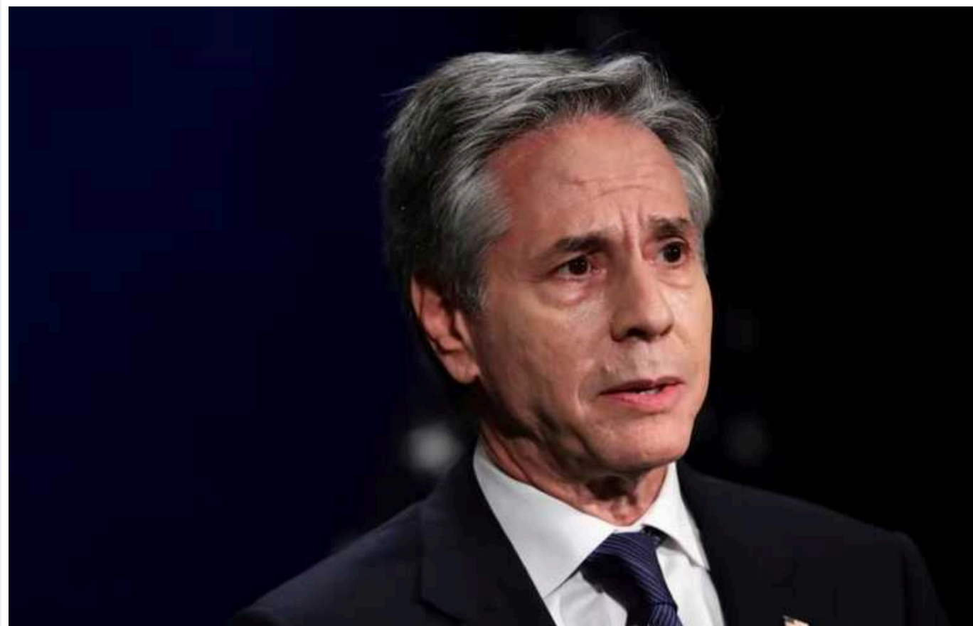
Франція та США застерігають від подальшої ескалації конфлікту на Близькому Сході

Держсекретар США Ентоні Блінкен та міністр закордонних справ Франції Стефан Сежурне в телефонній розмові обговорили ситуацію на Близькому Сході.