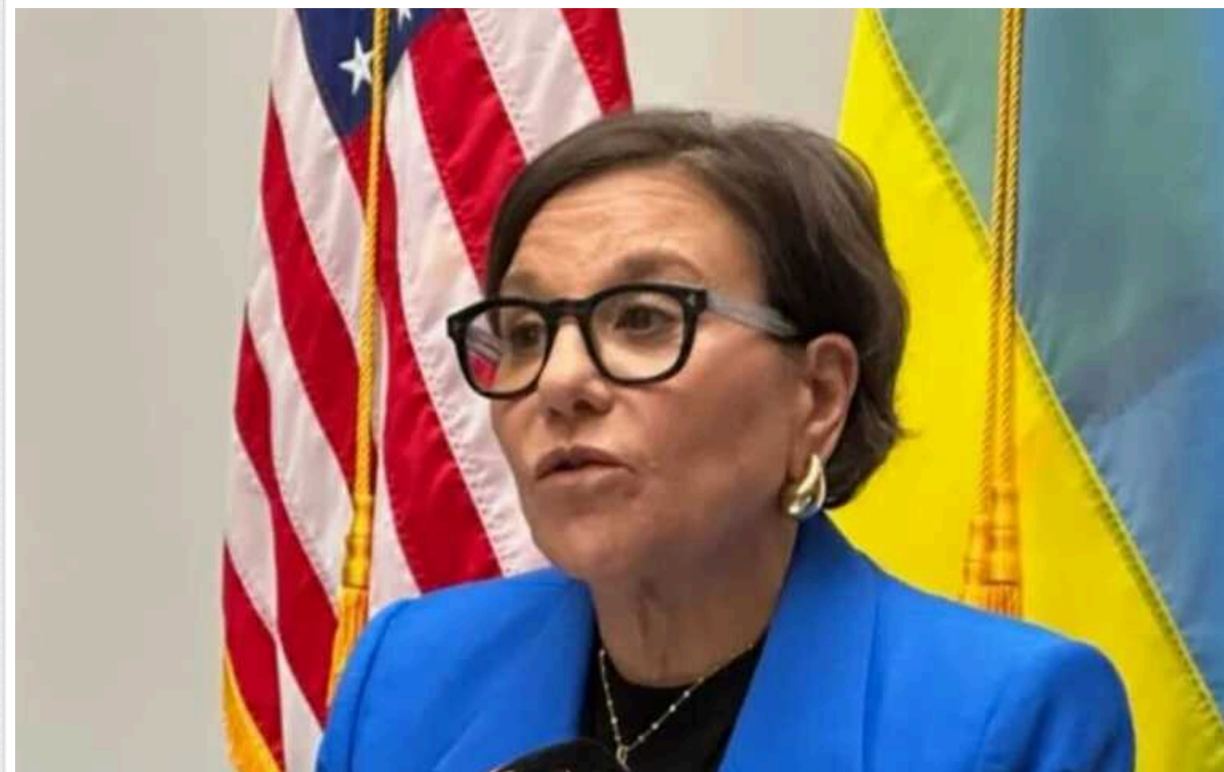
Пріцкер назвала 5 ключових умов для успішної відбудови України

Для успішного економічного відновлення України необхідні єдиний проєкт планування реконструкції, збільшення кількості готових проєктів, продовження антикорупційних реформ, залучення світового капіталу та повернення українців з-за кордону. Майбутнє України визначатиметься не лише тим, як вона виграє війну, а й тим, як вона "виграє мир".