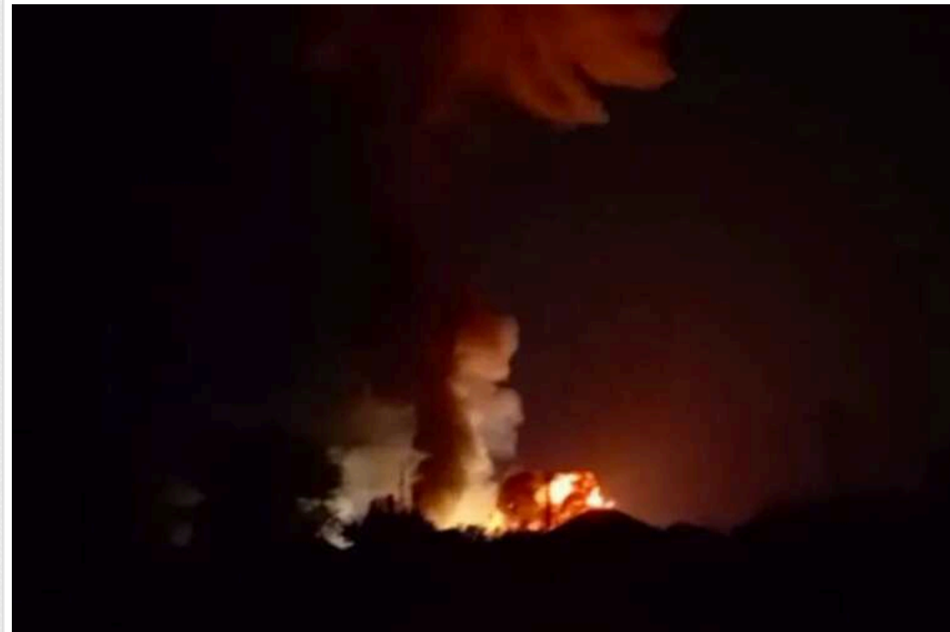
В РФ на аеродромі «Морозовськ» ЗСУ знищили Су-34 та склад авіаційного озброєння

У ніч проти 3 серпня Сили оборони України атакували військовий аеродром "Морозовськ" у Ростовській області РФ 40 безпілотниками. До визначених цілей долетіли 18 із них, влаштувавши на об'єкті потужну "бавовну".