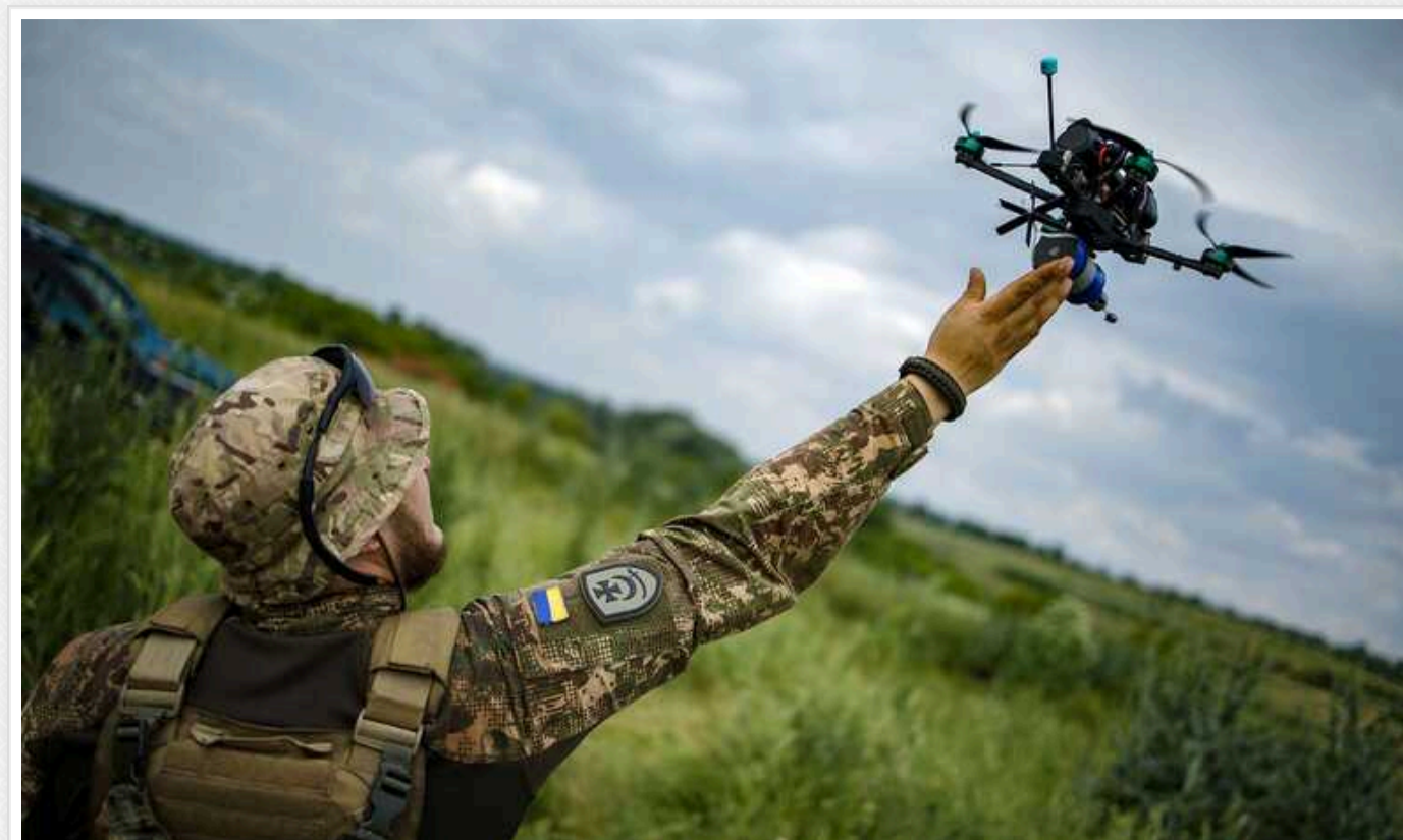
Захисники України знищили КамАЗ окупантів на Харківщині

Пілоты БПЛА з підрозділу "Гострі картузи" показали, як знищували автомобільну техніку ворога на Харківщині. Зокрема, вони уразили КамАЗ із особовим складом ЗС РФ.