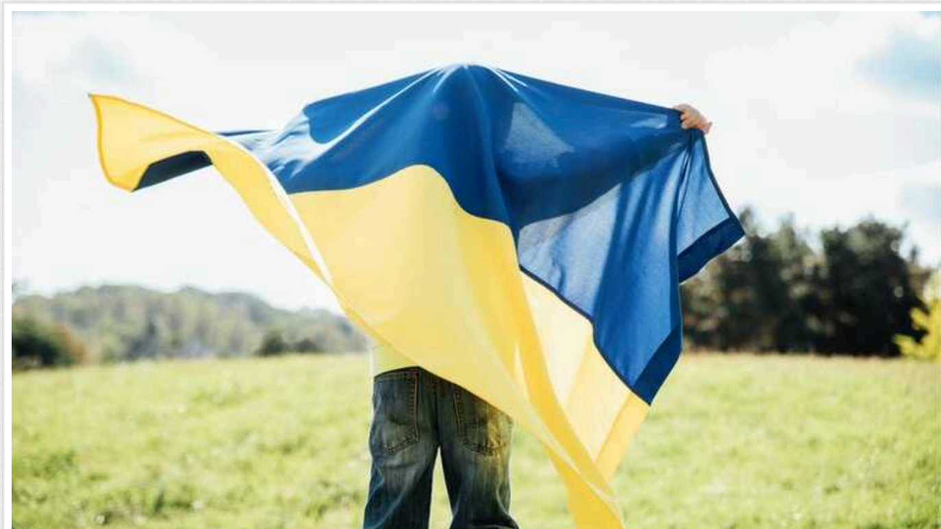
Протягом тижня 23 дитини вдалося повернути з окупації на підконтрольну Україні територію

За минулий тиждень з тимчасово окупованих Херсонської, Запорізької та Луганської областей вдалося вивести 23 дитини, серед яких троє дітей-сиріт. Поверненням дітей займалася команда Save Ukraine спільно з Bring Kids Back UA.