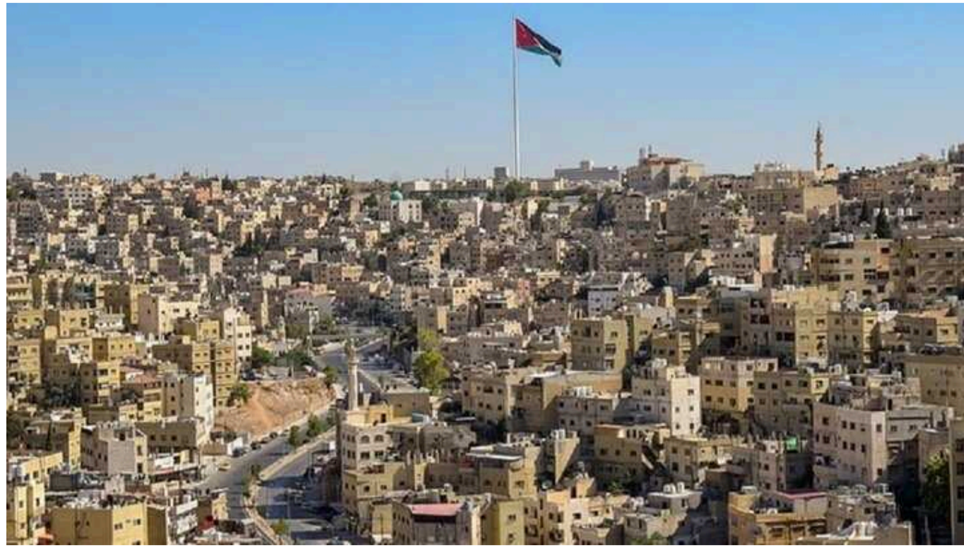
Швеція закриває своє посольство в Бейруті через загрозу ескалації на Близькому Сході

Швеція тимчасово закриває своє посольство в Бейруті через побоювання, що війна в Газі може перерости в загальнонаціональний конфлікт.