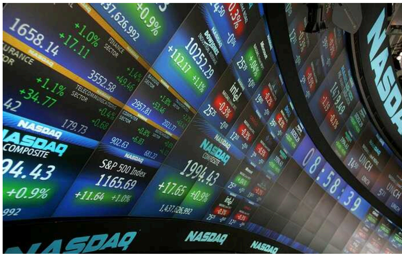
На світових фондових ринках іде грандіозний обвал