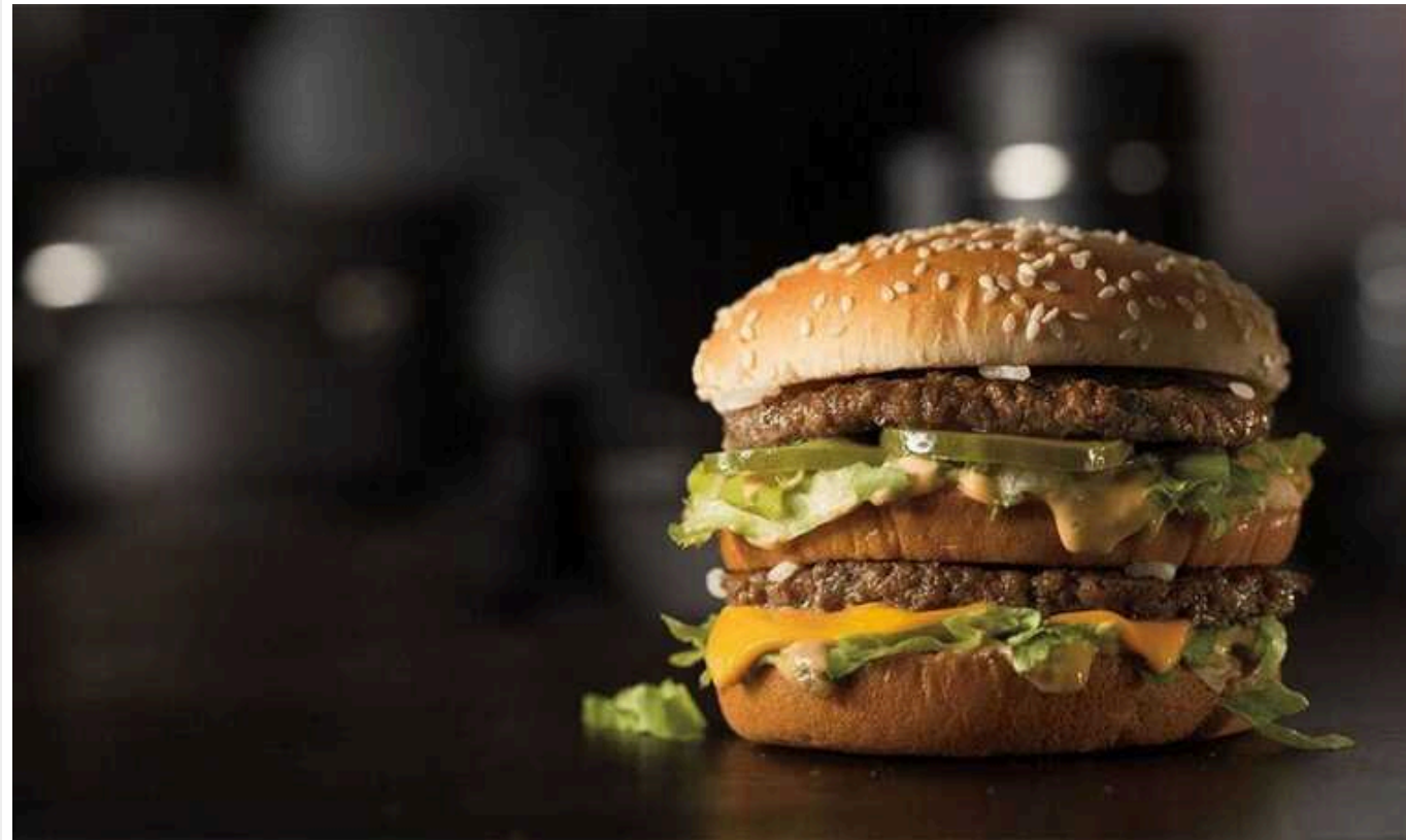
The Economist: Курс долара в Україні має бути вдвічі нижчим за Індексом Біг-Маку

В Україні визначили індекс Біг Маку, згідно з яким "реальний" курс гривні має бути 20,74 грн за долар.