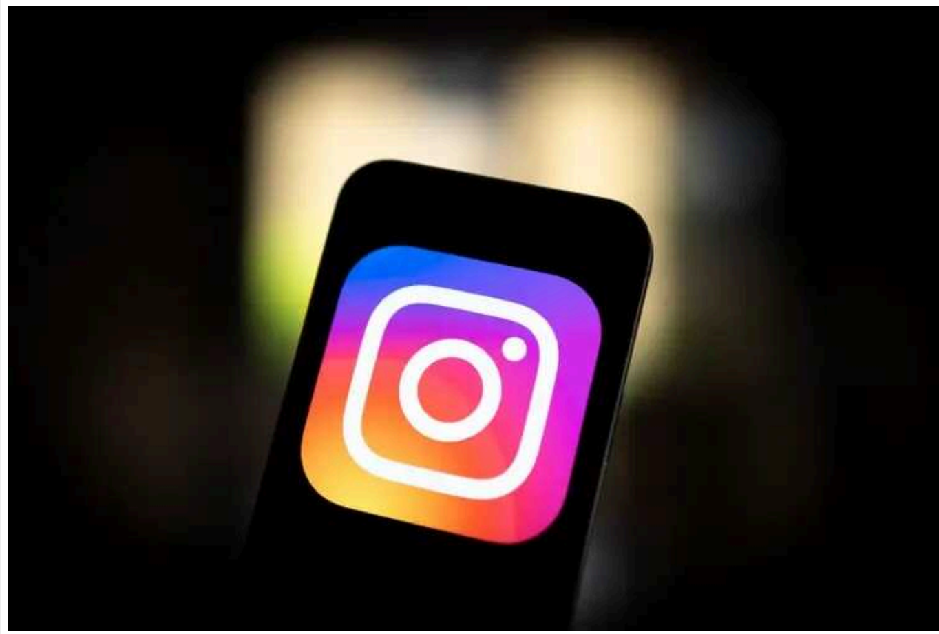
«Ми не змогли увійти до Ізраїлю, давайте хоча б увійдемо в Instagram!», – турецький журналіст

На тлі сьогоднішнього блокування інстаграма в Туреччині репліка турецького журналіста Ісмаїла Саймаза завірусилася: «Ми не змогли увійти до Ізраїлю, хоч би хоч увійдемо в Instagram!».