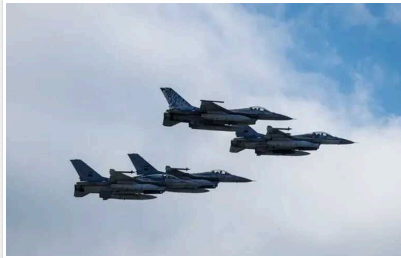
ЗСУ наразі не будуть інтегрувати F-16 у завдання ППО, – ISW

В Україні західні винищувачі F-16 наразі не запрацюють на повну потужність, адже захисники отримали обмежену кількість цих бортів, наголошують в Інституті вивчення війни США. Експерти в останньому звіті припускають, що, ймовірно, знадобиться кілька місяців, аби Повітряним силам "поставили їх у масштабі".