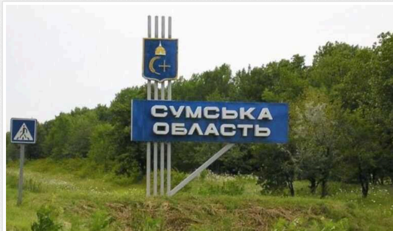
Росіяни дроном атакували Сумщину: поранено людину

Через дронову атаку Росії Сумщини отримала поранення одна цивільна особа. Окупанти вночі та зранку атакували три громади області.