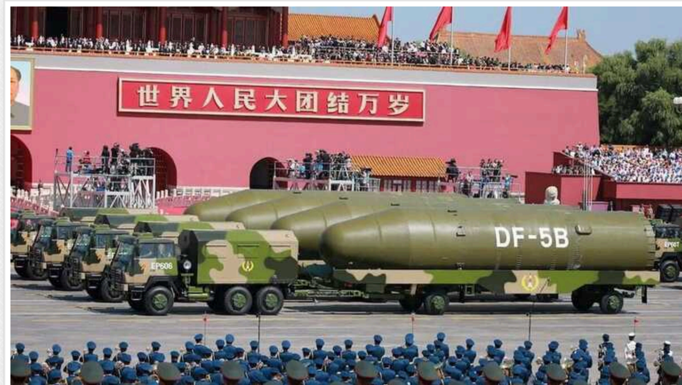
FT: КНР зобов'язалась не застосовувати ядерну зброю першою, проте розширює свій арсенал

Китай почав дипломатичний тиск на позиції США в ядерній сфері, стрімко змінюючи власний ядерний потенціал.