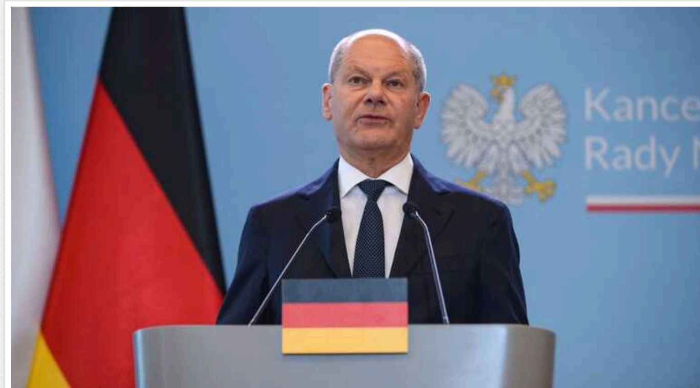
Канцлер ФРН прокоментував рішення Німеччини обміняти засудженого убивцю-росіянина Красікова

Канцлер Німеччини Олаф Шольц у четвер ввечері особисто зустрів в аеропорту літак зі звільненими з Росії ув'язненими, відстоюючи рішення обміняти засудженого убивцю Вадима Красікова.