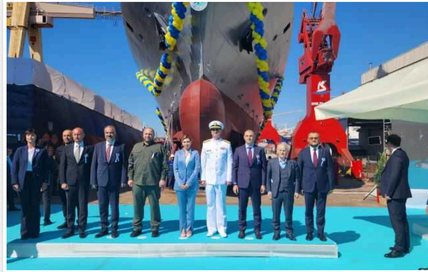
У Стамбулі на воду спустили корабель "Гетьман Іван Виговський" для ВМС ЗСУ

Сьогодні, 1 серпня, у Стамбулі на верфі STI було спущено на воду другий корвет класу Ada, який будеється для України - "Гетьман Іван Виговський".