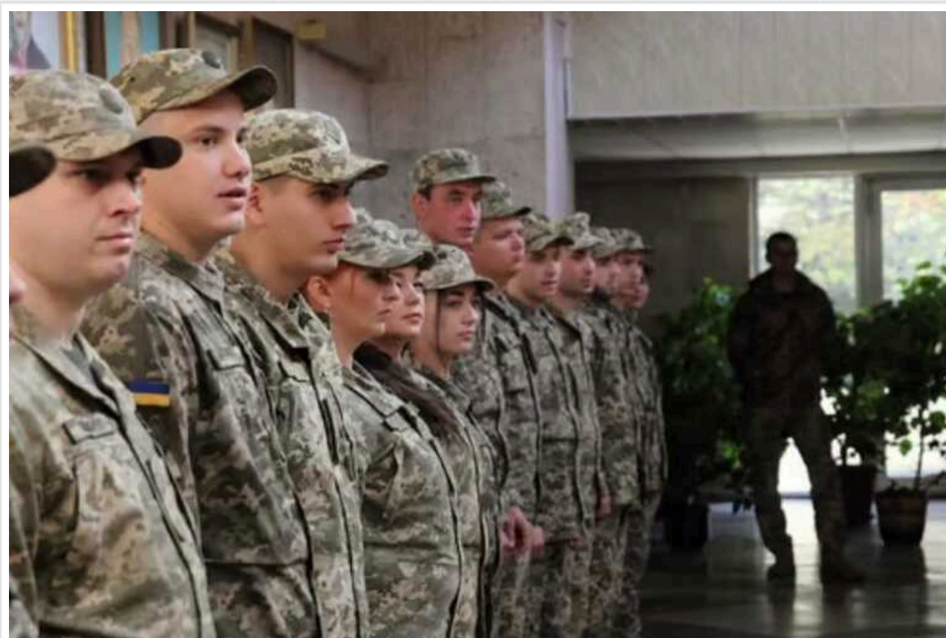
Командири зможуть здійснювати призов чоловіків, які виявили бажання проходити військову службу, без участі у цих заходах ТЦК