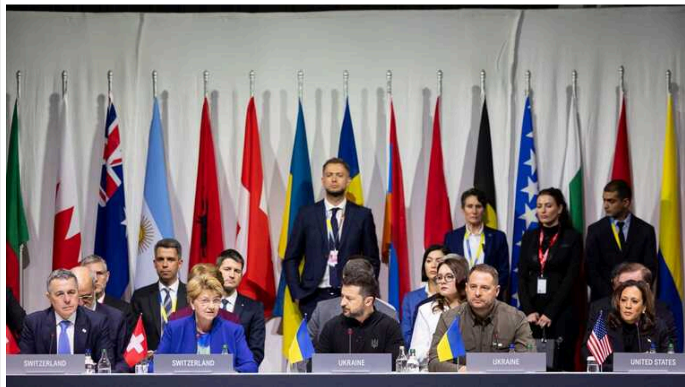
Україна хоче провести другий саміт лідерів, щоби прокласти шлях до припинення бойових дій

Про це пише Bloomberg із посиланням на главу Офісу українського президента Андрія Єрмака.