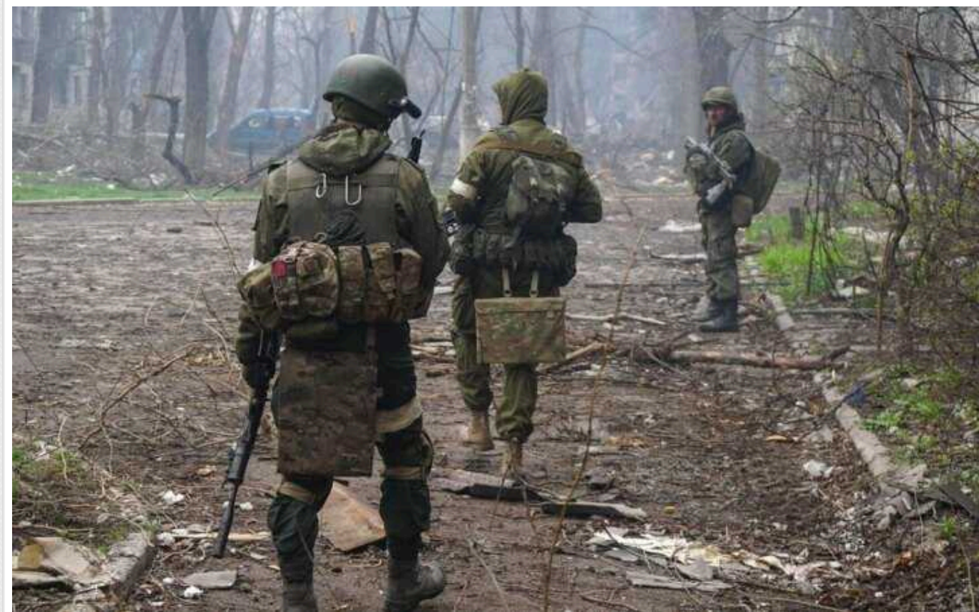
У ЗСУ розповіли про тактику наступу окупантів у районі Часового Яру

Окупаційні війська продовжують наступальні дії на Бахмутському напрямку, в районі Часового Яру Донецької області.