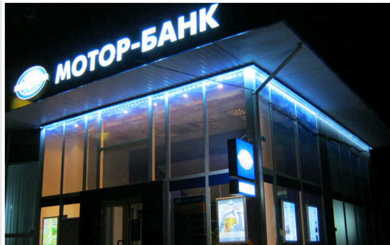
В Україні з'явився новий державний банк - "Мотор-Банк"

В Україні стало більше державних банків. Згідно з рішенням Вищого антикорупційного суду, "Мотор-Банк" та інші активи підсанкційного бізнесмена В'ячеслава Богуслаєва стягнули в дохід держави й передали в управління Фонду державного майна (ФДМУ).