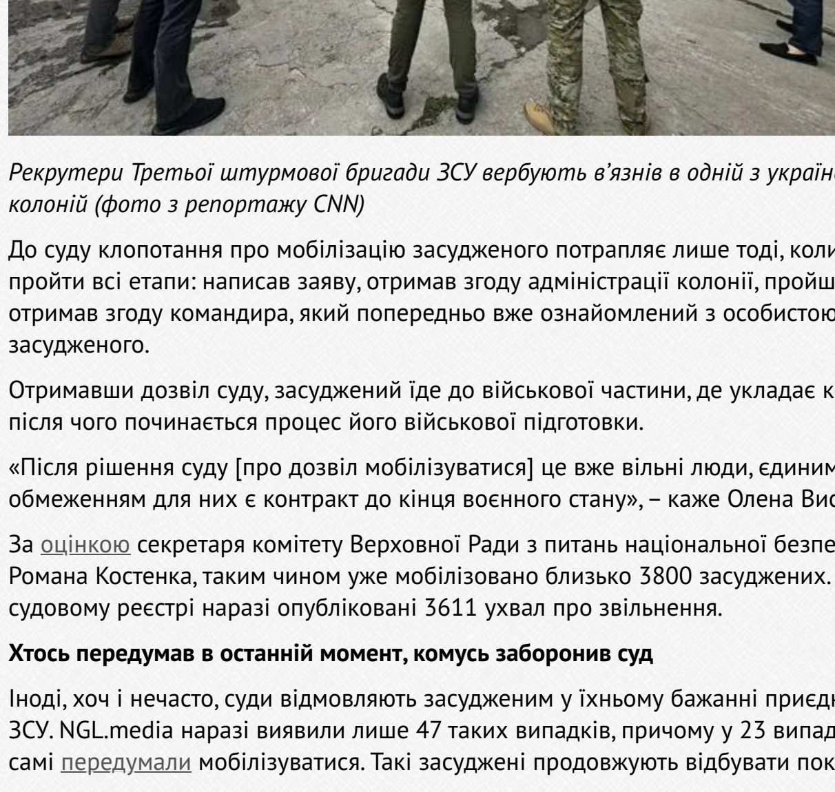
Рекрутери Третьої штурмової бригади ЗСУ вербують в'язнів в одній з українських колоній

За словами Висоцької, коли у колонії набирається певна кількість бажаних мобілізуватися, туди запрошують представників різних бригад, які розповідають про особливості служби. При цьому засуджені мають змогу обрати своє місце служби. У випадку, якщо командир бригади все ж відмовиться брати конкретного засудженого, він чекатиме у колонії, поки його не погодиться взяти хтось інший.