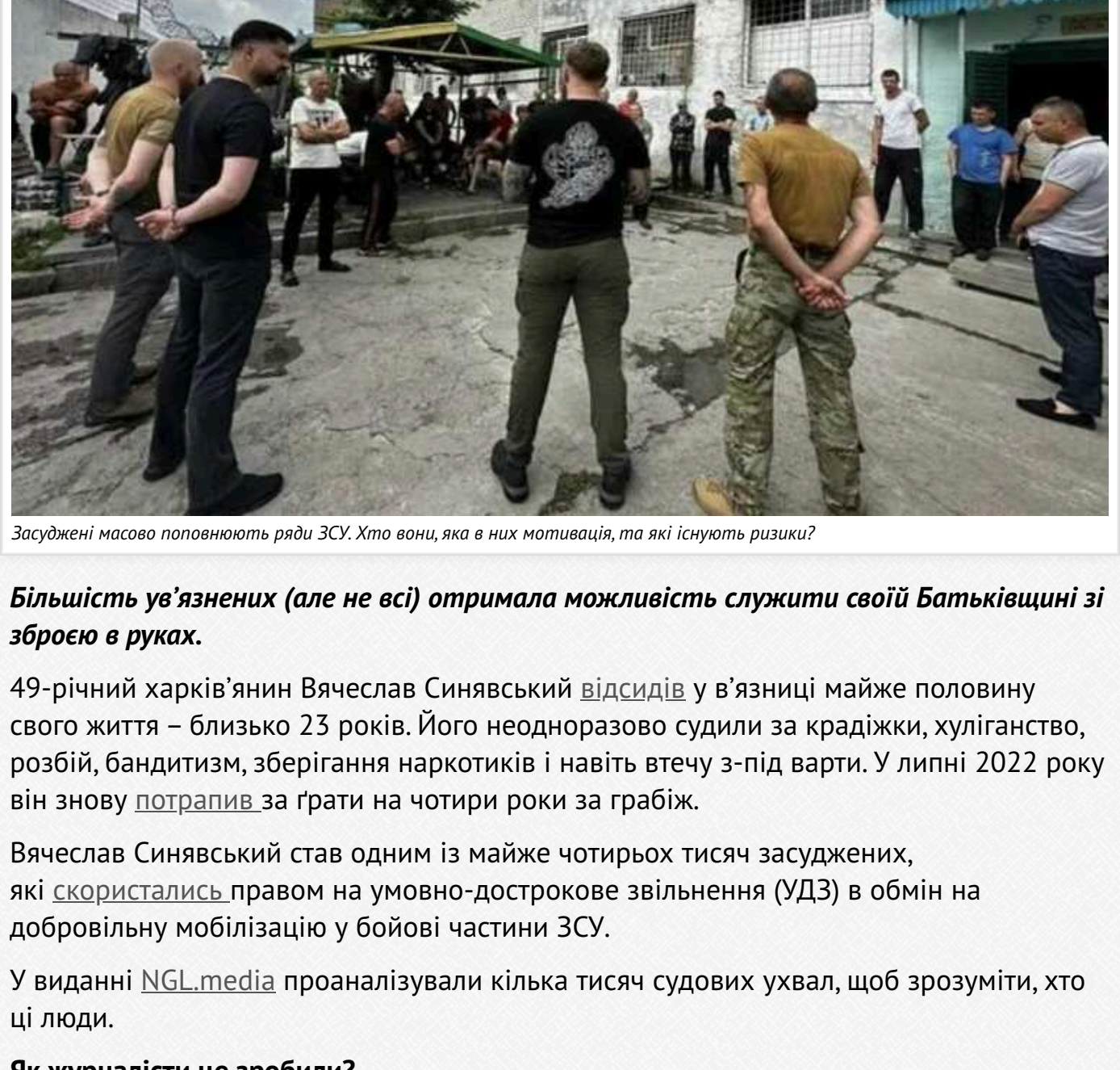
Засуджені масово поповнюють ряди ЗСУ. Хто вони, яка в них мотивація, та які існують ризики?

Більшість ув'язнених (але не всі) отримала можливість служити своїй Батьківщині зі зброєю в руках.