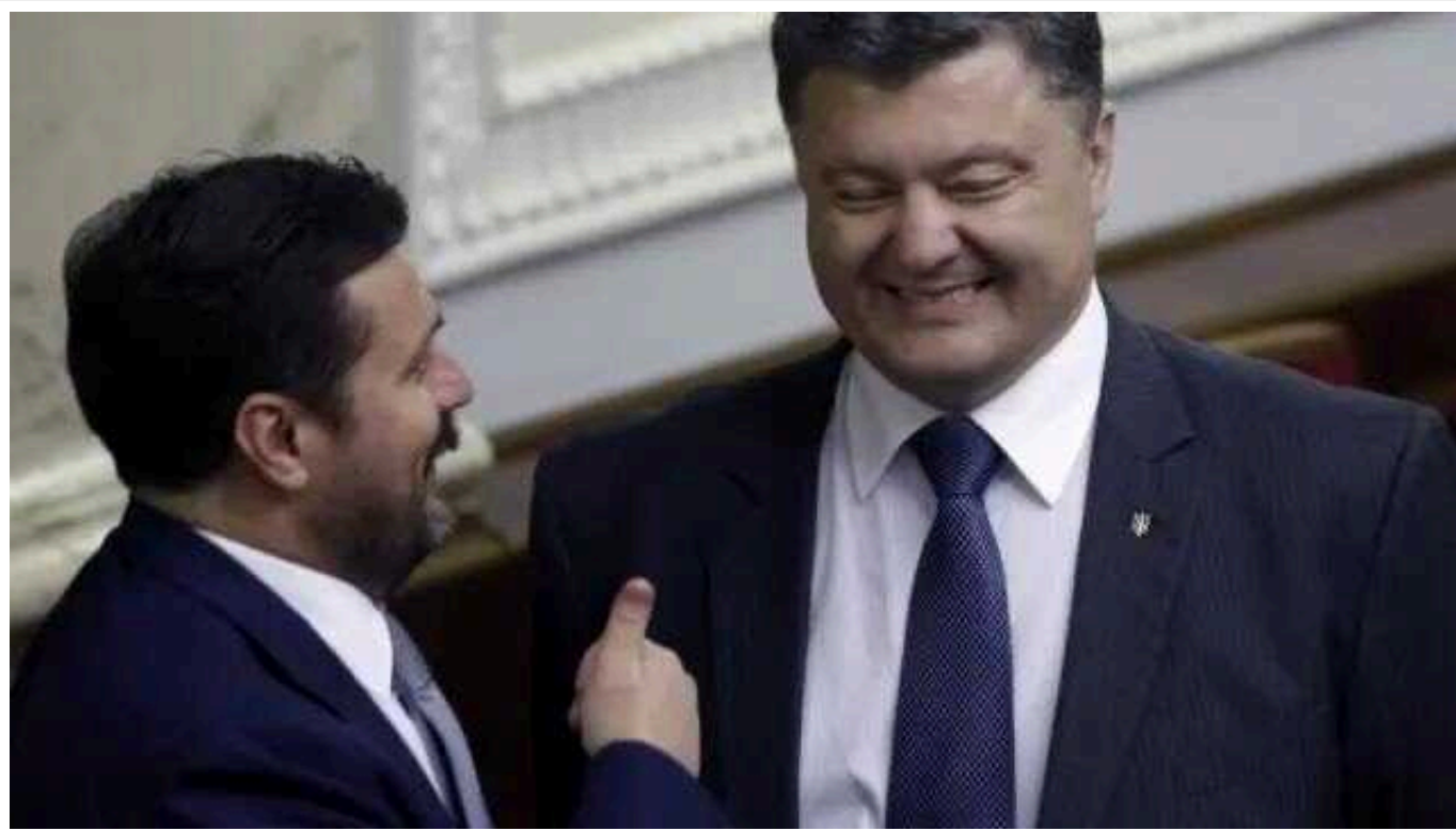
Порошенко та Деркач співпрацювали: перший не заважав працювати агенту РФ в обмін на роботу свого бізнесу в Росії, - Іванов

Петро Порошенко за часів свого президентства не заважав агенту спецслужб РФ та екснардепу Андрію Деркачу координувати дії великої агентурної мережі в Україні. В обмін на це Путін дозволяв лідеру «Євросолідарності» вести бізнес в Росії.