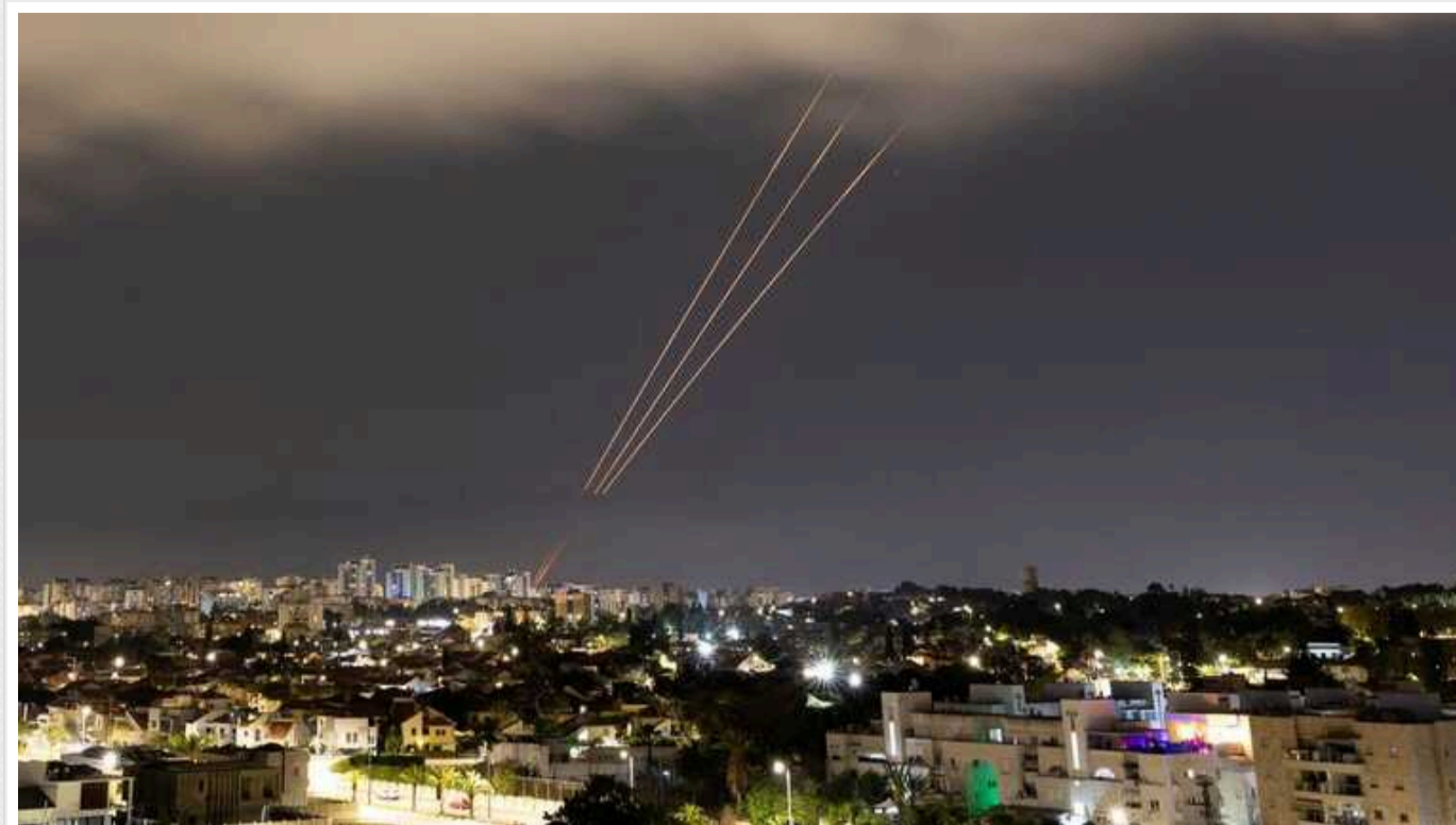
CNN: У найближчі 72 години Іран почне великомасштабну атаку на Ізраїль

Іран і його союзники розпочнуть масовану атаку на Ізраїль у найближчі 72 години. Верховний лідер Ірану аятолла Алі Хаменеї віддав наказ Ірану завдати прямого удару по Ізраїлю на знак помсти за вбивство в Тегерані лідера ХАМАС Ісмаїла Ганії.