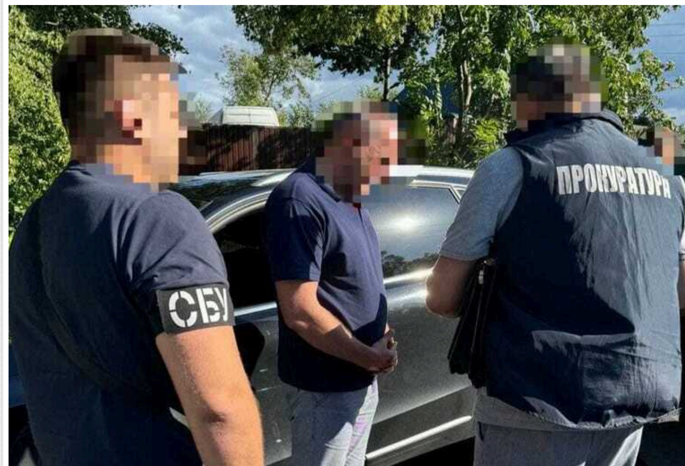
На Рівненщині голова громади погорів на хабарі

Голові однієї з територіальних громад Рівненщини повідомили про підозру в одержанні неправомірної вигоди в значному розмірі, а ще двом чоловікам – у пособництві та одержанні неправомірної вигоди службовою особою.